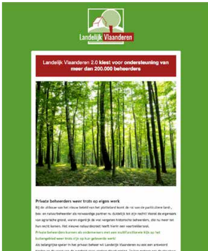
Sponsoringmogelijkheden in de maandelijkse nieuwsbrief

Maandelijkse nieuwsbrief met exclusieve uitnodigingen & luchtige nieuwtjes.