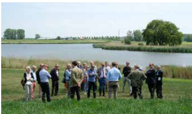
Foto's genomen tijdens de Algemene Ledenvergadering 2019 hoeve Engelendaal